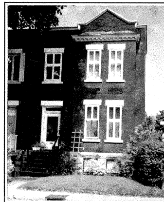
Côté nord de l'avenue Somerville: avancées en baie, accents de pierre et parapets articulés.

York (côté sud): les ouvertures sont généralement arquées. Les maisons sont jumelées ou détachées.