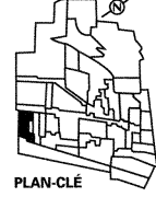
PLAN-CLÉ Valeur patrimoniale: ÉLEVÉE Degré d'homogénéité: ÉLEVÉ