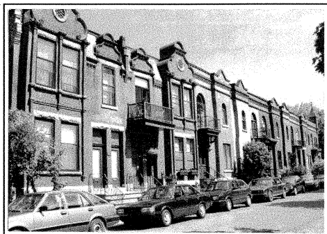
Côté nord de l'avenue Winchester: avancées en baie, balcons et parapets articulés.

Stationnement: puisqu'il n'y a pas de ruelle et peu d'espace à l'avant des bâtiments, il est rarement possible de stationner sur un terrain privé et la plupart des voitures sont stationnées sur la rue.