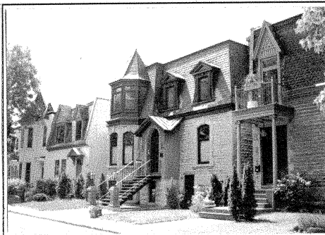
Avenue Elm: maisons de deux étages avec fausses mansardes et avancés en baie.

Wood: on retrouve à peu près le même nombre de maisons à deux et trois étages. Elles ont presque toutes de fausses mansardes. Elles ont toutes des fenêtres ou des avancés en baie avec des tourelles. Les avancés en baie présentent toujours des fenêtres en groupe de deux. Pratiquement toutes les entrées ont des portes doubles avec des carreaux supérieurs.