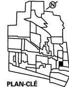
PLAN-CLÉ Valeur patrimoniale: ÉLEVÉE Degré d'homogénéité: ÉLEVÉ